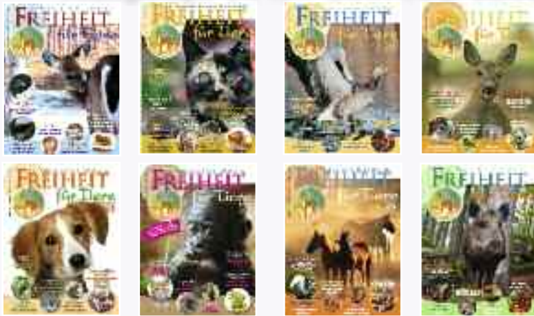
Ausgabe 2012 · Nr. 154 nur € 4,- Ausgabe 2011 · Nr. 155 nur € 4,-

Zum Nachlesen und Weitergeben: Bestellen Sie »Freiheit für Tiere«