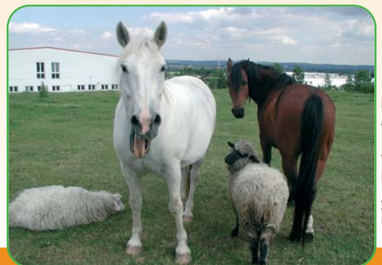
Bilder: Freiheit für Tiere