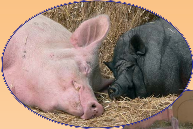
Bilder: Heimat für Tiere