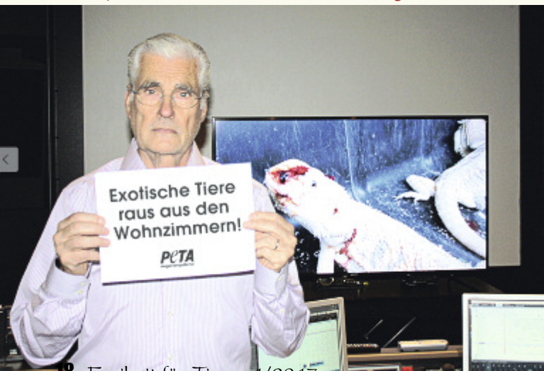
Unten: Der Schauspieler und langjährige PETA-Unterstützer Sky du Mont, hier im Tonstudio, hat ein Video eingesprochen, das die schockierende Wahrheit über den Handel mit exotischen Tieren für den deutschen Heimtiermarkt zeigt.