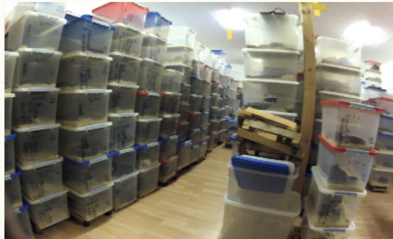
Oben: Schlangen werden bei einem Großhändler oft mehrere Jahre in kleinen Plastikboxen »vorrätig« gehalten.