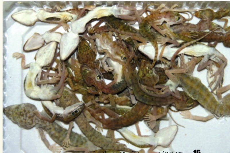
Unten: Diese Geckos aus Ägypten haben den Transport nicht überlebt.