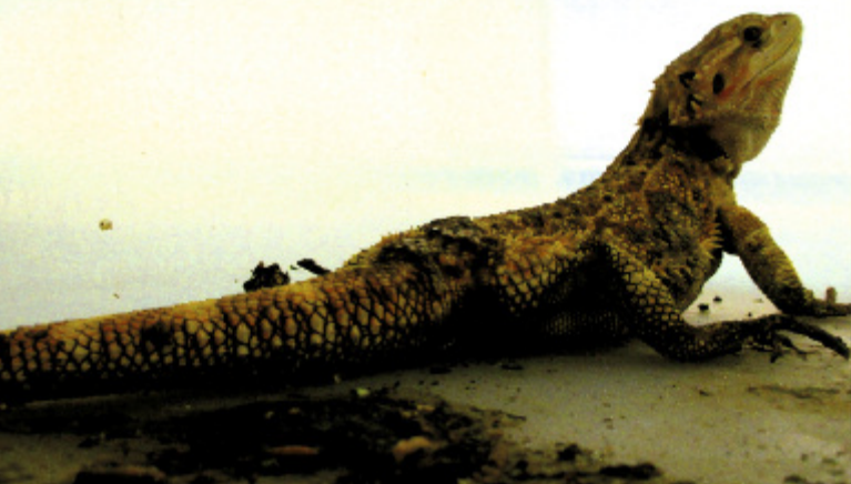
Reptilienhaltung bei einem Exotenhändler in den USA: Viele Tiere sind abgemagert, halb verdurstet, verletzt oder krank.