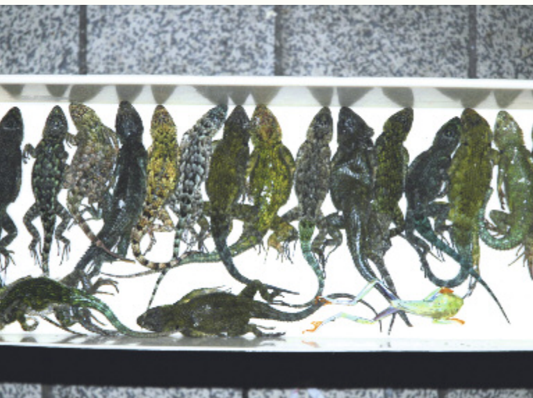
Oben: Diese Tiere starben auf dem langen Transport nach Deutschland.