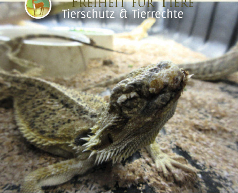
Diese völlig abgemagerte und durstende Bergagame ringt bei einem US-Großexporteur mit dem Tod.