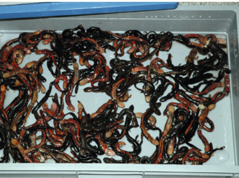
Oben: Ein großer Teil der Tiere überlebt den Transport nicht. Diese Amphibien wurden tot geliefert. Unten: Sterberaten von bis zu 70 Prozent sind vom Handel bereits einkalkuliert.