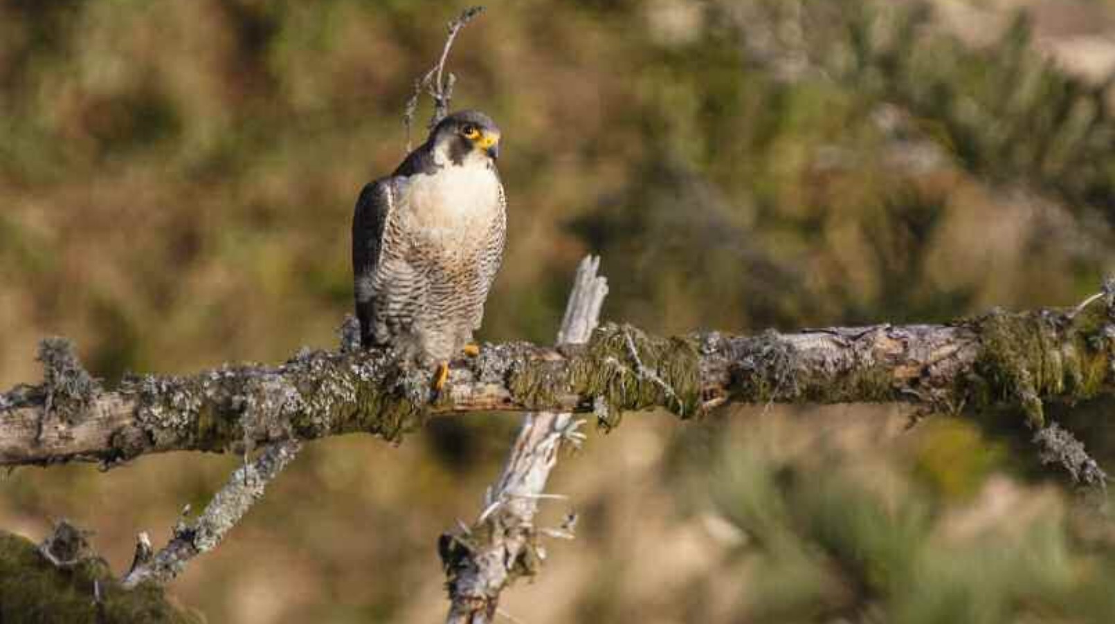
Der schnellste Vogel der Welt, der Wanderfalke, ist im Nationalpark ebenso zu Hause wie die kleinste Eule Europas, der Sperlingskauz.