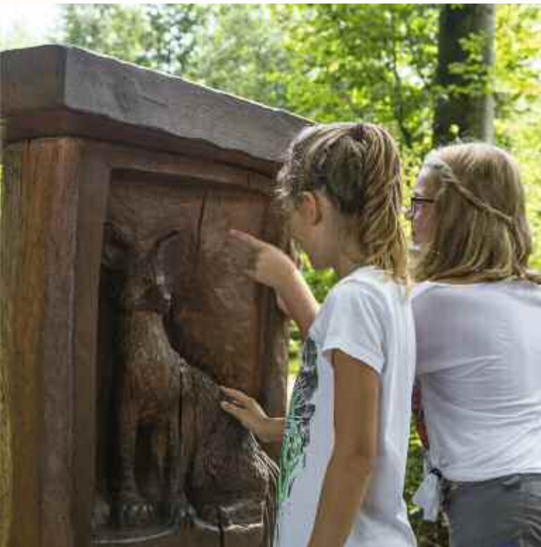
Junge Besucher erkunden den Luchspfad im Nationalpark Schwarzwald.

Der Buhlbachsee im Nationalpark Schwarzwald ist ein Inbegriff unberührter Natur. Spätestens in 30 Jahren bleiben drei Viertel der Nationalparkfläche ganz der Natur überlassen, ohne jeden Eingriff von Menschen.