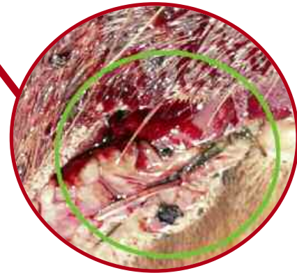
Metallpartikel am Mund