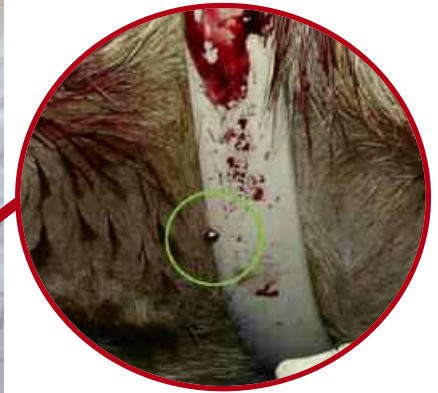
Metallpartikel am Flohhalsband