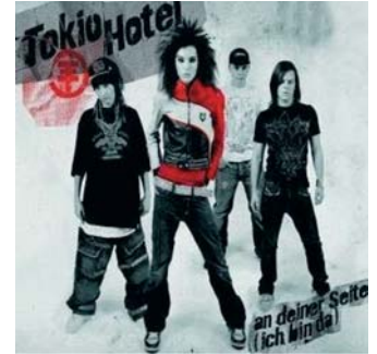
Vegetarisch auf Tour

Die Tokio Hotel-Zwillinge Bill und Tom Kaulitz (20) sind absolute Tierfreunde und haben selbst einige Hunde und Katzen. Ihre Tierliebe brachte sie nun zu der Entscheidung, Vegetarier zu werden. »Lösen sie einen neuen Trend aus?«, fragt »Promiflash«.