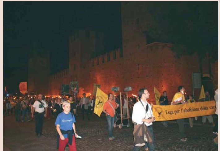
Fackelzug in Verona, September 2009: Mehr als 500 Menschen fordern ein Ende der Jagd

Quelle: Gemeinsame Pressemitteilung von NO ALLA CACCIA ( www.no-alla-caccia.org ) und LIGA ANTI CACCIA VENETO ( www.lacveneto.it ) vom 21.9.2009