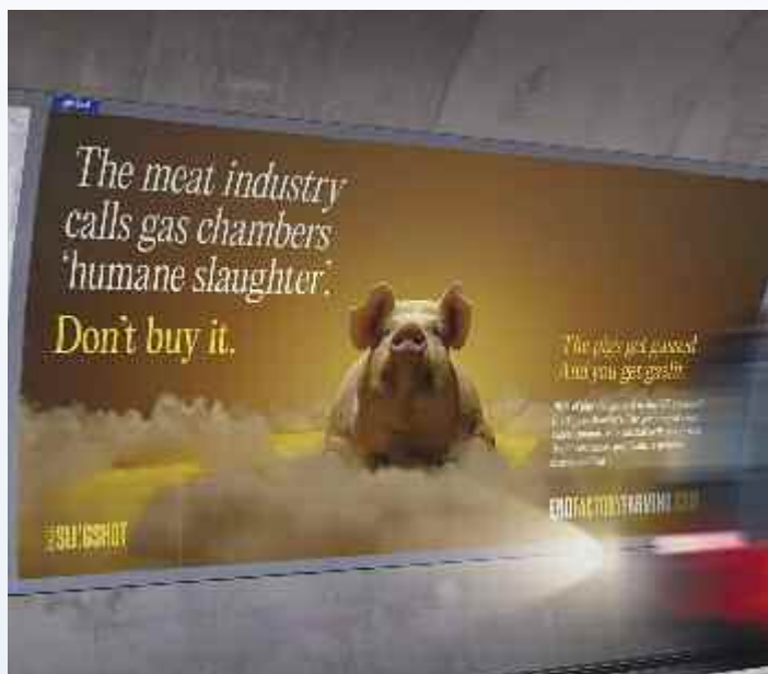
U-Bahn in London: »Die Fleischindustrie nennt das Vergasen von Schweinen 'humane Schlachtung'. Glaubt das nicht.«