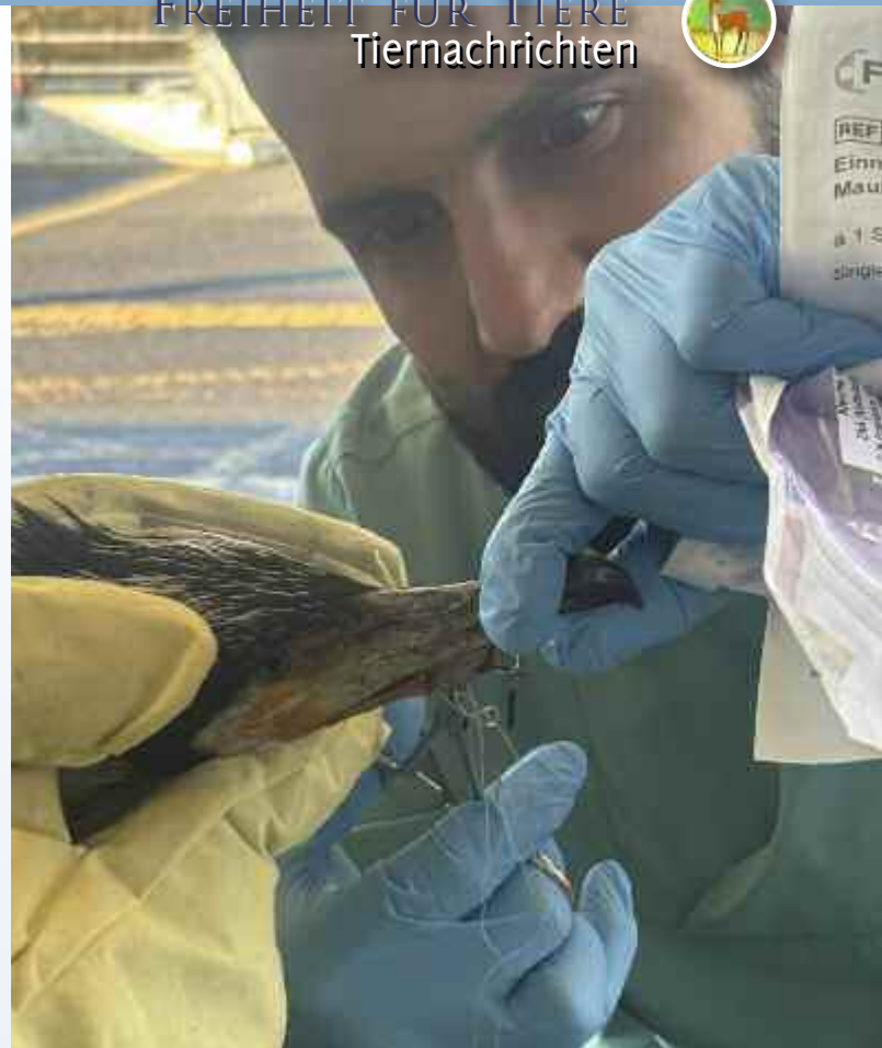
Nachdem der Angelhaken entfernt worden war, wurde der Kormoran von der Bremer Feuerwehr wieder in die Freiheit entlassen.