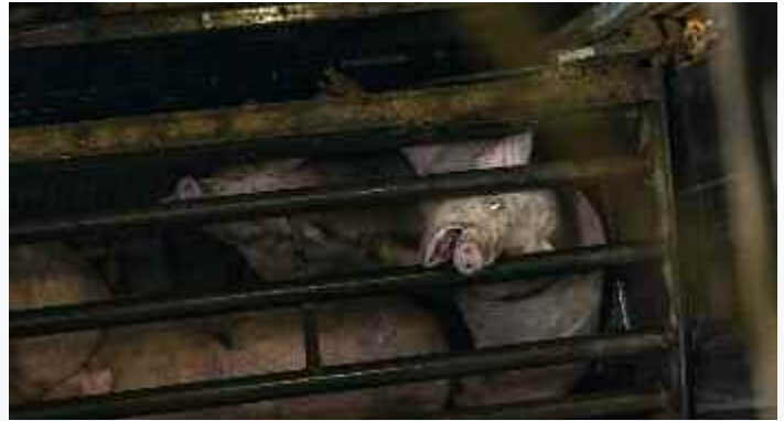
Schweine werden in engen Gondeln mit CO 2 -begast, was zu schweren Schmerzen und Erstickungsangst führt.