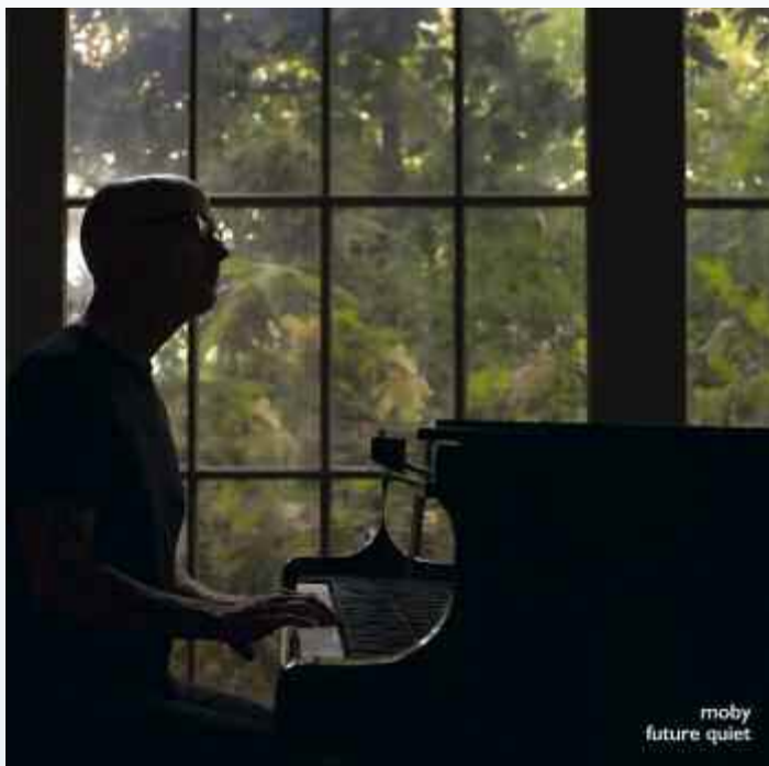
»Future Quiet« ist Mobys 23. Studioalbum.