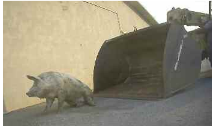
Historisches Urteil: Aufgrund der Klage einer Tierrechtsorganisation verurteilte ein italienisches Gericht Besitzer und Mitarbeiter dieser Schweinezucht wegen Tierquälerei.