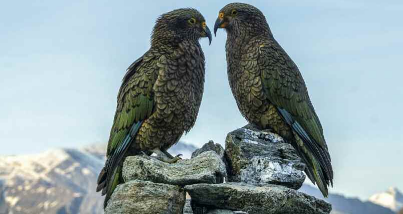
Ein Kea-Paar in der französischen Gratthütte im Nationalpark Mt Aspira in Neuseeland. Die vom Aussterben bedrohten Bergpapageien sind sich ein Leben lang treu.