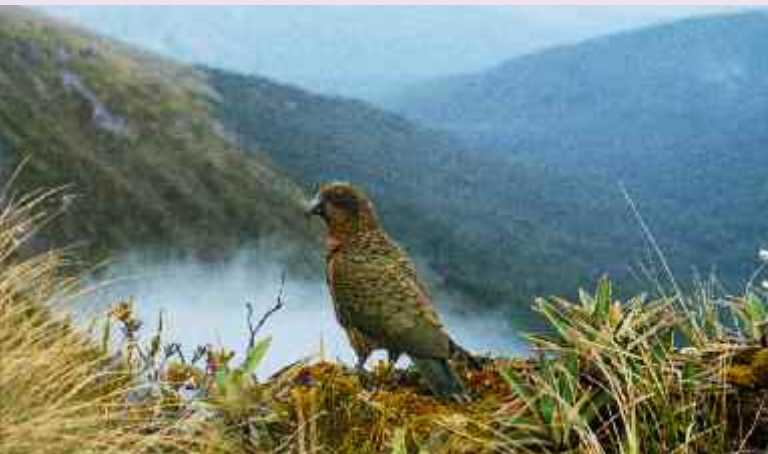
Kea im Fiordland National Park, Neuseeland. In der Abgeschiedenheit der neuseeländischen Berge haben Keas außerordentliche kognitive Fähigkeiten entwickelt.