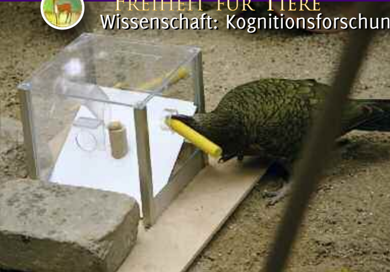
Kea Kermit löst den Stockeingang (oben) und manövriert einen Ball in eine Multi-Access-Box (unten), um eine Nuss herauszuholen.