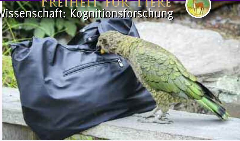
Bild unten und Bild rechts: Wer in den Bergregionen der Südinsel Neuseelands unterwegs ist, trifft vielleicht auf einen neugierigen Kea.

Mit bebilderten Versuchsbeschreibungen in ihrem Buch stellt und beantwortet Alice Auersperg Fragen wie: Was ist ein Werkzeug und wann kann man von Werkzeuggebrauch bei Tieren sprechen? Wie erfinden Tiere, und welche kognitiven Voraussetzungen müssen sie dafür aufweisen? >>>