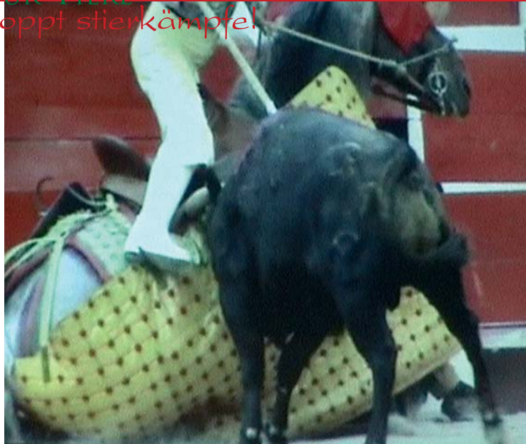
Beim Stierkampf leiden und sterben nicht nur Stiere - auch viele Pferde werden verletzt, zum Teil tödlich.

Jetzt beginnt die Arbeit des Matadors, der mit seinem roten Tuch einen lächerlichen Tanz aufführt, um sich vor dem Publikum zu produzieren. Seine Aufgabe ist es, den Stier mit einem Degen von etwa 80 cm Länge zu töten. Dazu muss er das so genannte »Nadelöhr« zwischen den Nackenwirbeln treffen, um die großen Blutgefäße zu verletzen und damit den sofortigen Tod des Stieres herbeizuführen. Selten trifft der Matador jedoch die richtige Stelle. In der Mehr-