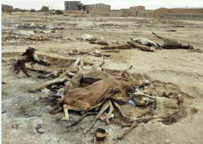
Auf dem Eselmarkt häufen sich zwischen Plastikresten und Metallabfällen die Leiber toter Tiere. Es sind die Ausgestoßenen der Gesellschaft - unbemerkt, unbewehrt. Daneben suchen Kinder im Inferno aus Müll nach Verwertbarem - einfach nur herzerreißend! Es ist eine Misere, die zum allergrößten Teil die Kolonialmächte ausgelöst haben. Auch daran sollten wir bei jedweder Beurteilung denken.