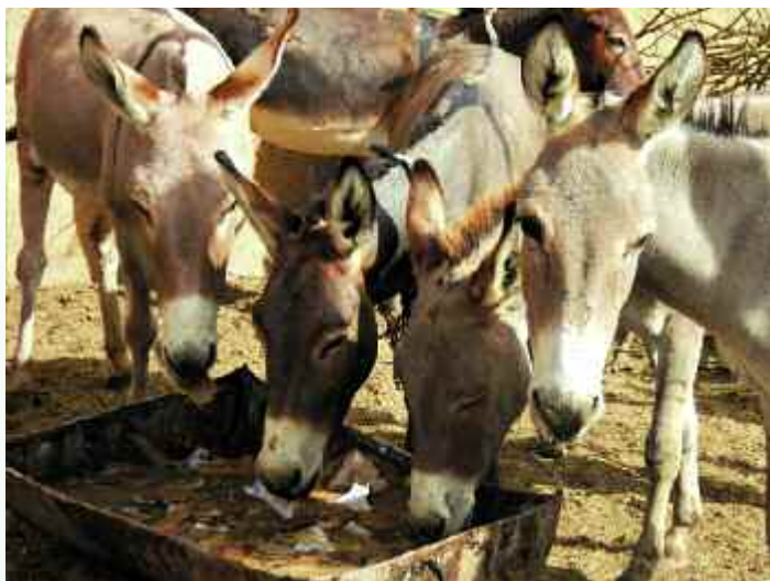
»Futtertränke« auf dem Eselmarkt - bestehend aus Wasser und darin eingeweichten Kartons...