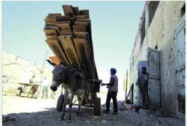
Das Haupttransportmittel sind Arbeitseesel, die viel zu schwere Lasten tragen und schwere Wasserfässer ziehen müssen. Die Esel sind übersät mit Wunden und Narben. Ihre Ernährung besteht aus zerkleinerten Kartons und der Suche nach Abfällen, wenn sie des Abends aus ihren Fesseln gelöst werden.