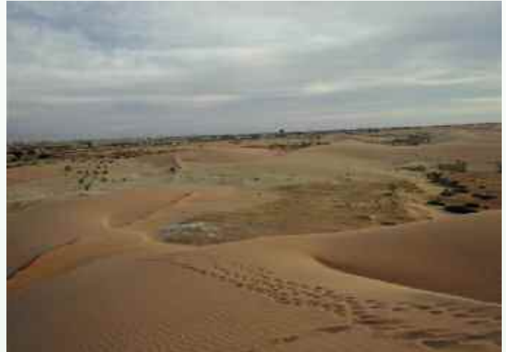
Mauretanien liegt im nordwestlichen Afrika am Atlantik und grenzt im Nordosten an Algerien. Das Land ist fast dreimal so groß wie Deutschland und besteht aus Wüste - mit Ausnahme einer Dornbuschsavannenzone entlang der Südgrenze.

Der Arme wird es schaffen, was allerdings die Zukunft für ihn bereithält, ist ein ganz anderes Thema... >>>