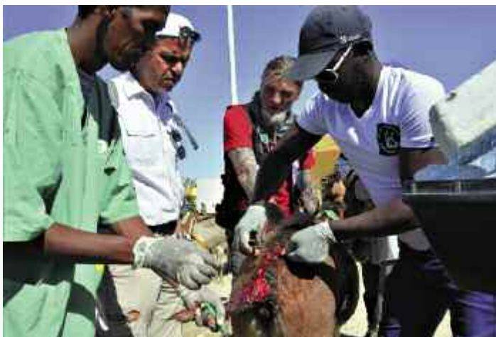
Auf diesen Esel hat ein Verrückter mit einem Messer eingestochen. Nach Lokal-Anästhesie wird die Wunde genäht. Eine Stunde lang dauert die Operation. Endlich ist es vorbei und der Esel springt auf. Dann wird der Halter in die Pflicht genommen...