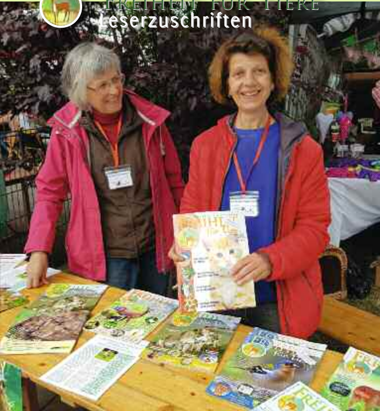
»Freiheit für Tiere«-Info-Stand beim Sommerfest des Tierheims in Lippstadt: Informationen über Massentierhaltung und Hobbyjagd.