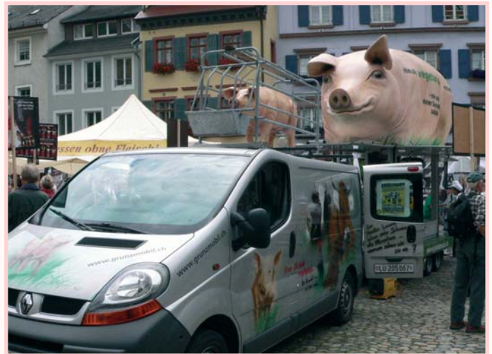
Das Grunzmobil auf der Anti-Fleisch-Demo in Freiburg/Deutschland

Infos: Verein der Schweinefreunde Waldstätterstrasse 27 · CH-6003 Luzern Tel.: 0041- 41 210 25 51 · e-mail: info@schweine-freunde.ch Internet: www.grunzmobil.ch