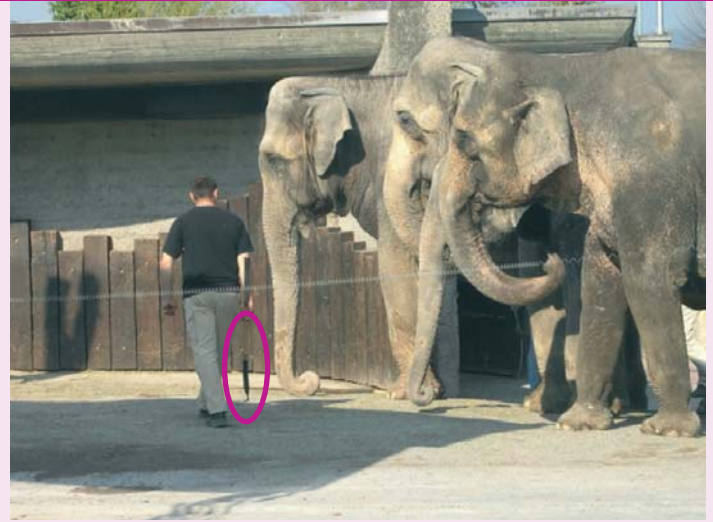
Elefantenfleger mit Haken in der Hand - so versucht man, die grauen Riesen gefügig zu machen