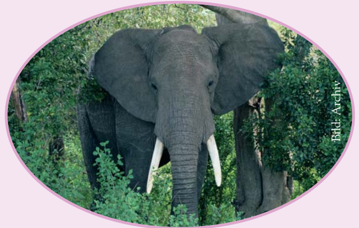
Elefanten gehören in die Freiheit, nicht in den Zirkus!

Infos: KAT - Kein Applaus für Tierquälerei Waldstätterstrasse 27 · CH-6003 Luzern Tel.: 0041- 41 210 25 51 · e-mail: info@zirkusinfo.ch Internet: www.zirkusinfo.ch