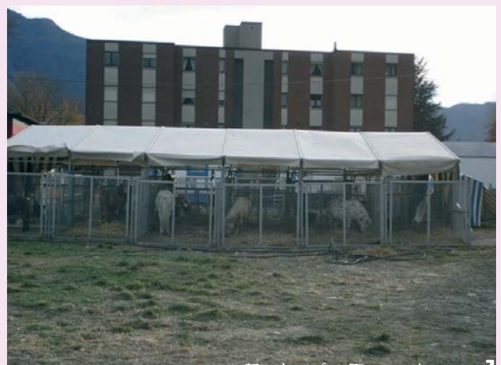
Doch im Zirkus ist auch für Ponies und Pferde kein artgerechtes und würdiges Leben möglich

Infos: KAT - Kein Applaus für Tierquälerei Waldstätterstrasse 27 · CH-6003 Luzern Tel.: 0041- 41 210 25 51 · e-mail: info@zirkusinfo.ch Internet: www.zirkusinfo.ch