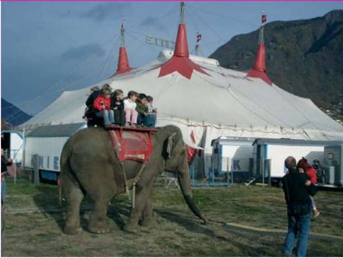
Zirkus Knie: Elefantenreiten vor dem Zirkuszelt - für die Tiere kein Vergnügen