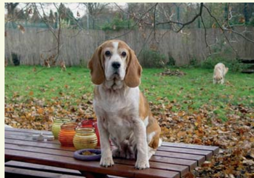
In ihrer Pflegefamilie hat es für die treue Hündin endlich begonnen - das Leben